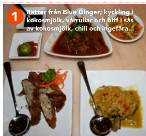
1 Rätter från Blue Ginger; kyckling i kokosmjölk, vårrullar och biff i sås av kokosmjölk, chili och ingefära.