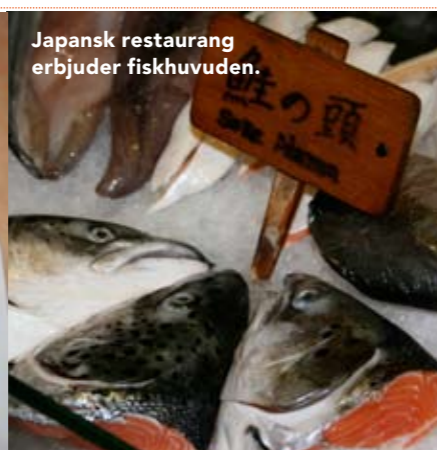
Japansk restaurang erbjuder fiskhuvuden.