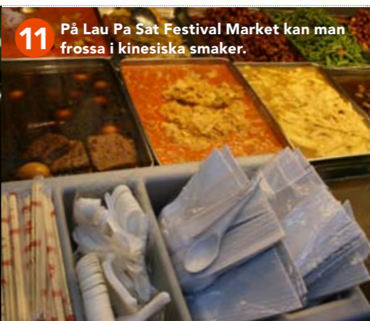
11 På Lau Pa Sat Festival Market kan man frossa i kinesiska smaker.