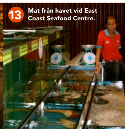
13 Mat från havet vid East Coast Seafood Centre.