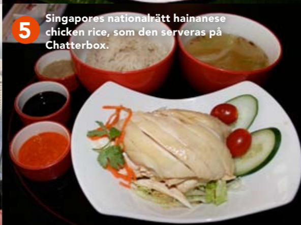
5 Singapores nationalrätt hainanese chicken rice, som den serveras på Chatterbox.