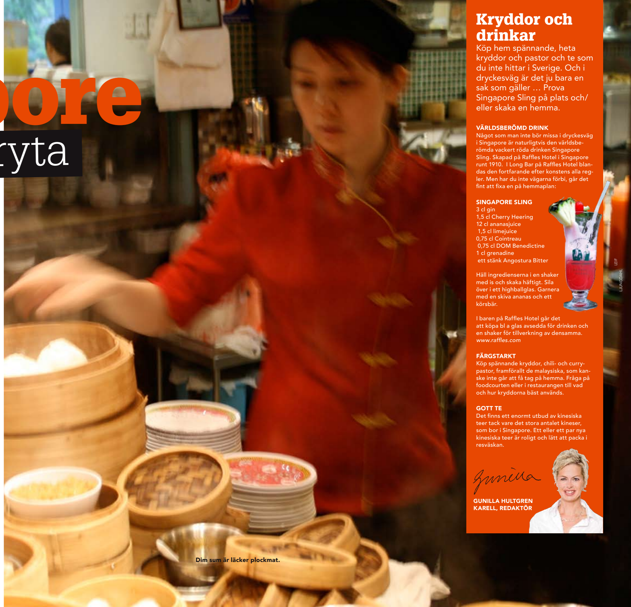
Dim sum är läcker plockmat.

» Roti prata är Singapores version av en pannkaka som har sitt ursprung från området kring norra Indien och Pakistan. Pannkakan har i Singapore fått influenser från flera kök och serveras här med exempelvis vitlök, choklad eller frukt. Populär till frukost, lunch och middag.