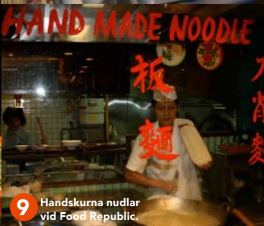
9 Handskurna nudlar vid Food Republic.