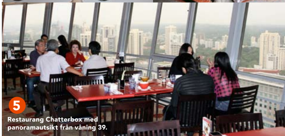
5 Restaurang Chatterbox med panoramautsikt från våning 39.