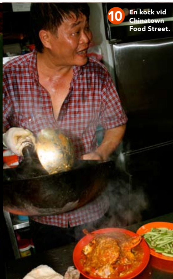
10 En köck vid Chinatown Food Street.