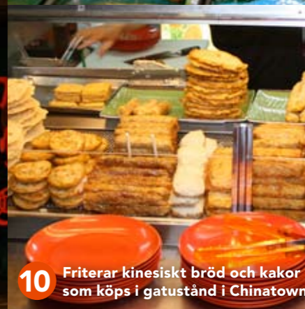
10 Friterar kinesiskt bröd och kakor som köps i gatustånd i Chinatown.